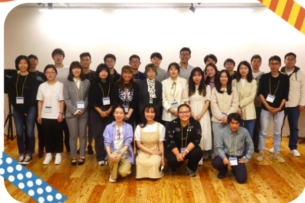
2023年度留学生交流推進員

日本語でのコミュニケーションはもちろん、さまざまな能力や特技を持った個性豊かな推進員が、県内の国際交流の活発化や多文化共生社会の推進に向けたお手伝いをさせていただきます。